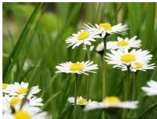
Pavína Říhová 8. B

Ve středu 9. dubna mohli rodiče spolu s malými předškoláčky navštívit naši školu a zúčastnit se „Vítání jara“. Děti si s pomocí našich žáčků z družiny mohly ozdobit obrovské velikonoční vajíčko, které se vystaví ve vestibulu školy a stane se součástí jarní výzdoby školy.