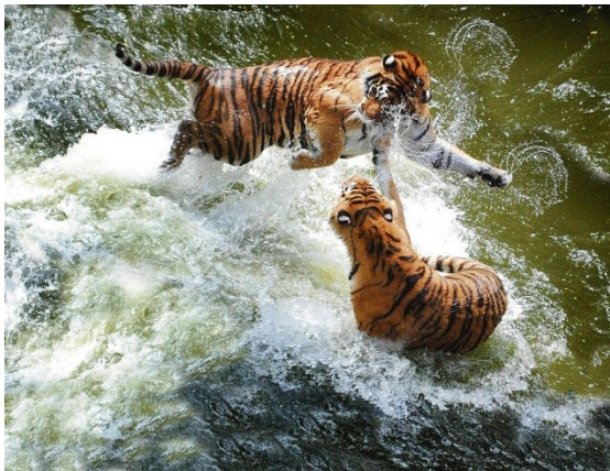
Nikol Táborská, 8. B

Tygr je větší než lev „král zvířat“, a tedy je největší kočkovitá šelma. V minulosti byl v mnoha poddruzích rozšířen prakticky po celé Asii , od Turecka až po Koreu a Indonésii . Dnes je na seznamu ohrožených druhů a to hlavně kvůli člověku. V divočině se tyto šelmy dožívají kolem desátého roku, v zajetí je to déle. Tygři nežijí ve skupinách, jsou to spíše samotáři. Říká se, že kočky nemají rády vodu, u těchto šelmiček to ale neplatí, jsou to milovníci vody. Existuje také vzácný druh tygra- tygr bílý.